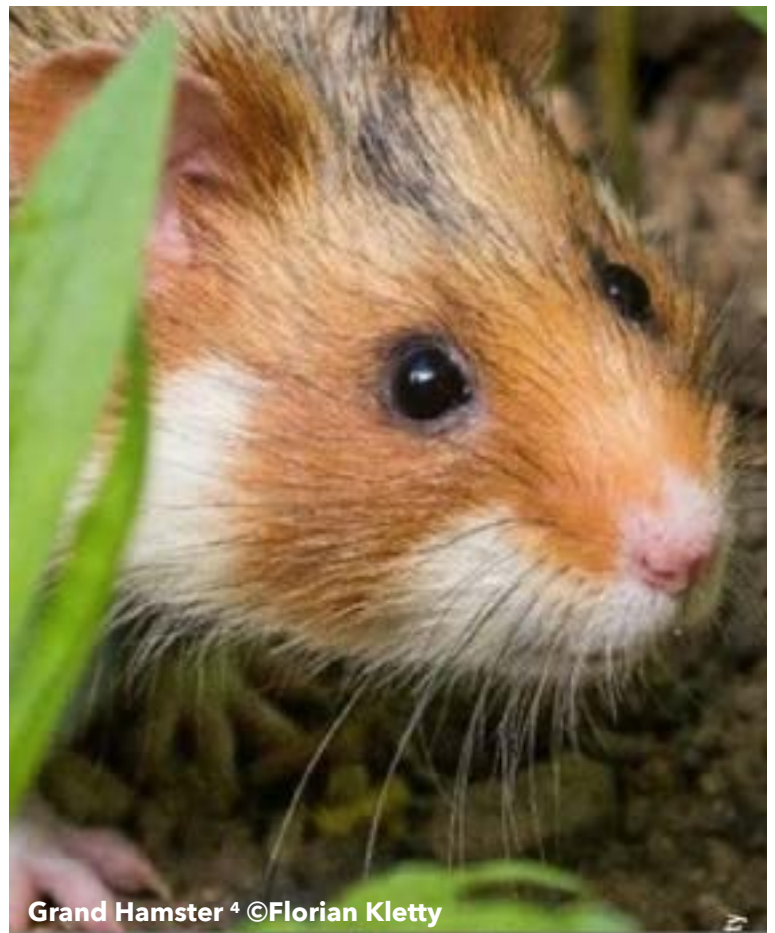
Grand Hamster 4

“La campagne de comptage des terriers de grand hamster réalisée au printemps en Alsace a permis d’en identifier 960, contre 488 l’année dernière. Un résultat jugé « encourageant », même si les effectifs de Cricetus cricetus « restent encore fragiles et en deçà du seuil de viabilité ”. 5