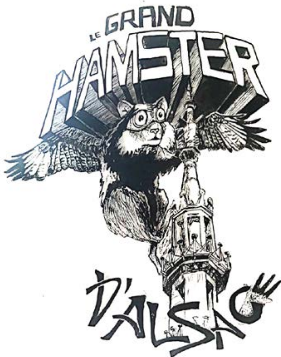
Super Hamster : premiere apparition !

Il y a quelques années, j'ai dessiné une caricature d'un super héros, c'était, bien sûr, un hamster. Mais finalement il n'était pas simplement habillé comme Batman, il était devenu une créature surnaturelle, dotée d'ailes de Milan royal, tout aussi beau et lui aussi en danger. Posé sur la pointe de la Cathédrale de Strasbourg, Super Hamster observe la plaine d'Alsace, prêt à venir en aide aux hamsters. Quelle image !