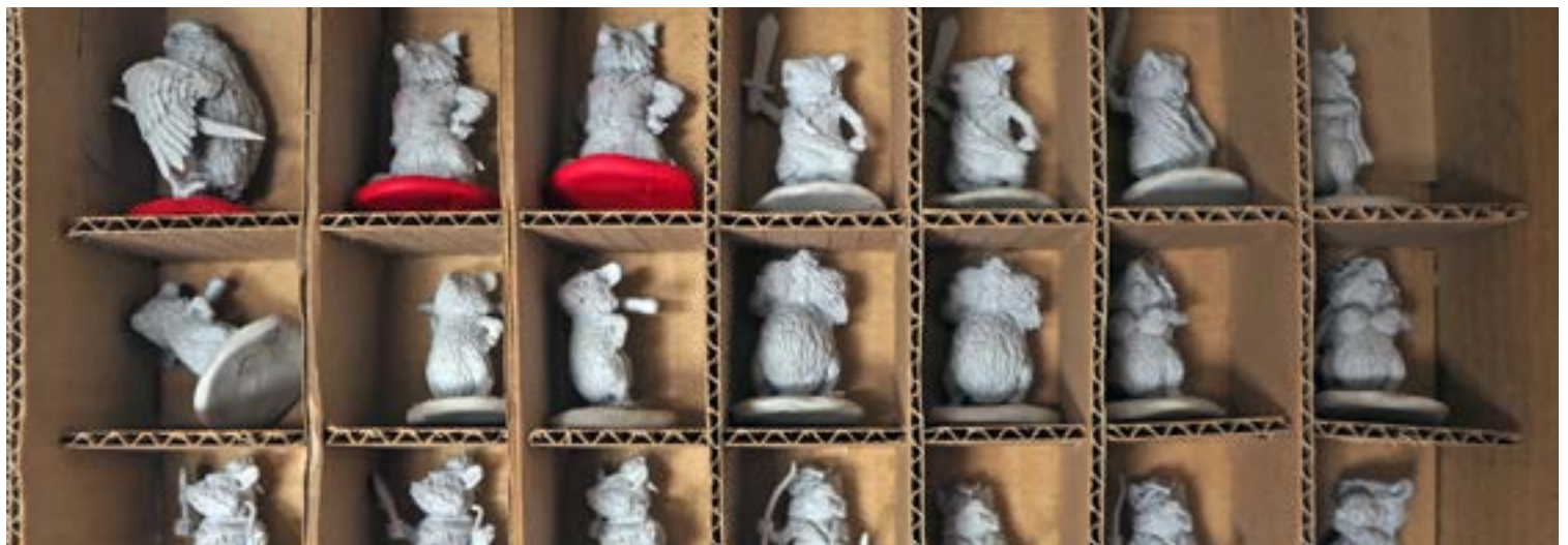
Hamsters and predators attendent leur tour !

HTTPS://KICKSTARTER.COM/PROJECTS/GRANDHAMSTER/ DE-HAMSTER-KUMMT-WIEDER-HAMSTER-GOES-HOME